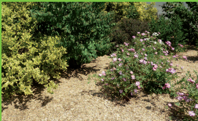
Paillage de miscanthus sur plantations.