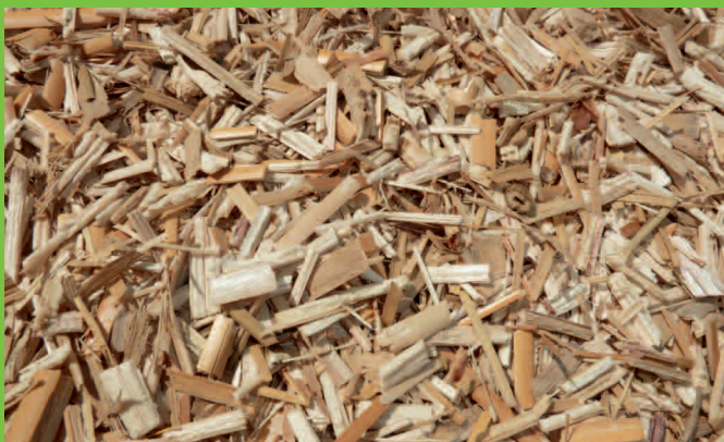
Paillage de miscanthus.