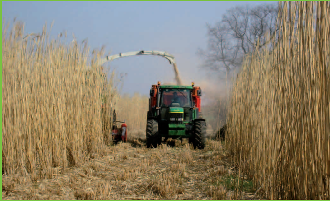
Récolte du miscanthus.